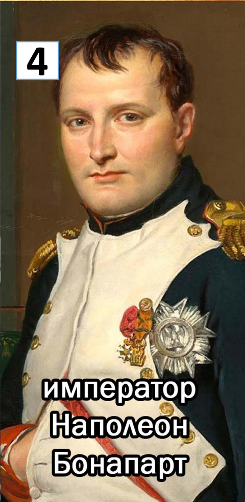
император Наполеон Бонапарт