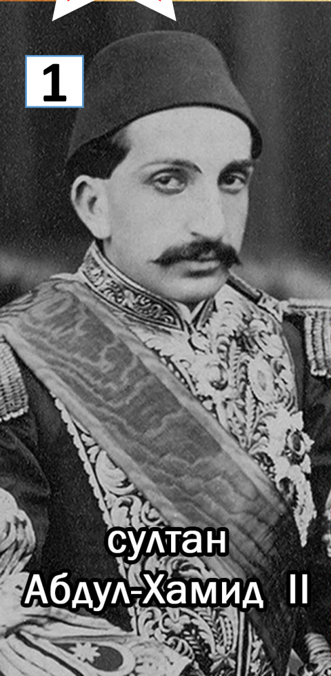
султан Абдул-Хамид II