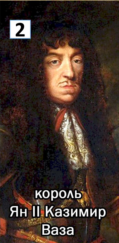
король Ян II Казимир Ваза